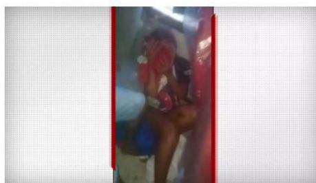
Torcedora do Parintins é atingida por pedra

O Parintins venceu o São Raimundo por 2 a 0 neste domingo, na primeira rodada do retorno do Amazonense. Após o jogo, a torcida do Parintins teve o ônibus apedrejado enquanto faziam o caminho de volta para Rio Preto da Eva, cidade em que o clube fica sediado. Uma mulher grávida foi atingida na cabeça e precisou ser levada ao hospital para levar pontos.